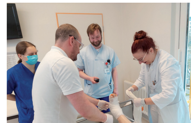
Versorgung des Diabetischen Fußsyndroms (DFS)