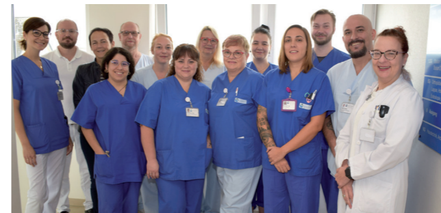
Das diabetologische Team: „Wir sind für Sie da!“