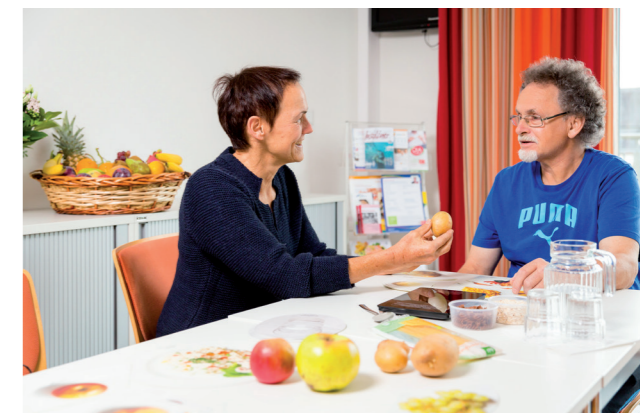
Patient wird geschult

Im Text sind Personen männlichen und weiblichen Geschlechts gleichermaßen gemeint; aus Gründen der einfacheren Lesbarkeit wird häufig nur die männliche Form verwendet.